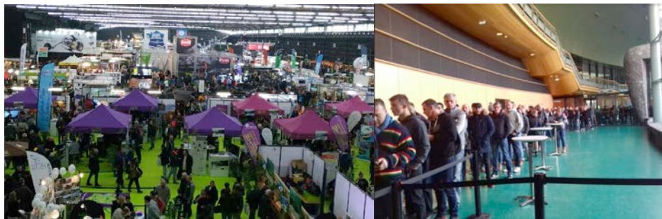
Entrer sur le Carrefour demandait une patience... de pêcheur !

Le nombre record de visiteurs sur le Carrefour National Pêche & Loisirs est venu apporter la preuve par l'affluence de la popularité d'une pêche plus que jamais dans l'air du temps. 26 300 personnes ont arpenté les allées de la Grande Halle d'Auvergne du 12 au 14 janvier 2018, une fréquentation en progression de 17 % par rapport à l'an dernier.